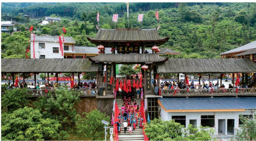
△石椅羌寨的进寨仪式备受游客喜爱。

象不禁让记者发出惊叹，记忆中的空地被一座两层楼的羌族传统建筑所取代，“农产品交易中心”几个大字映入眼帘。