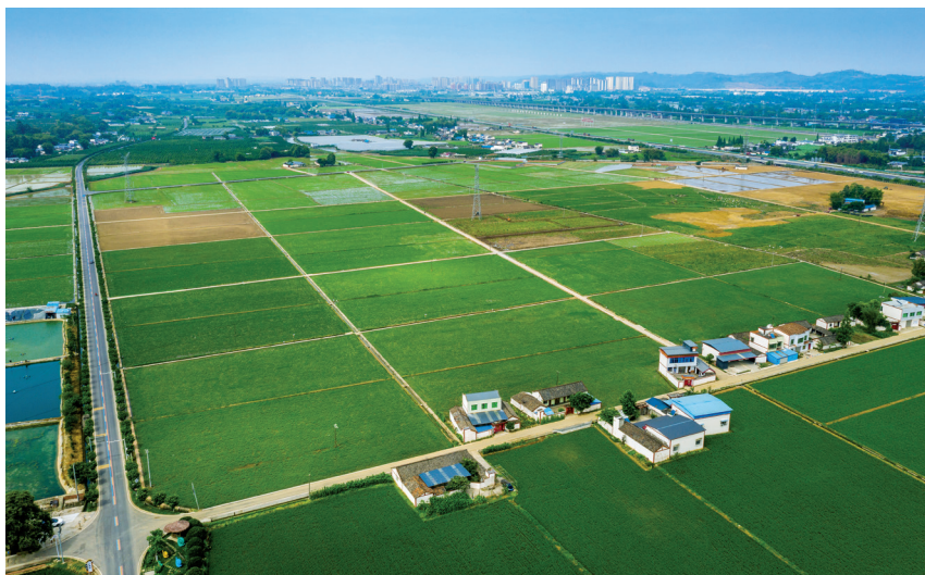
△ 永丰村风貌。