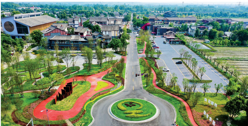
△战旗村风光。

“战旗万亩粮经现代农业园区”的标牌若隐若现。令人惊讶的是,即便在这样的雨天,前来考察学习的队伍依然不少。