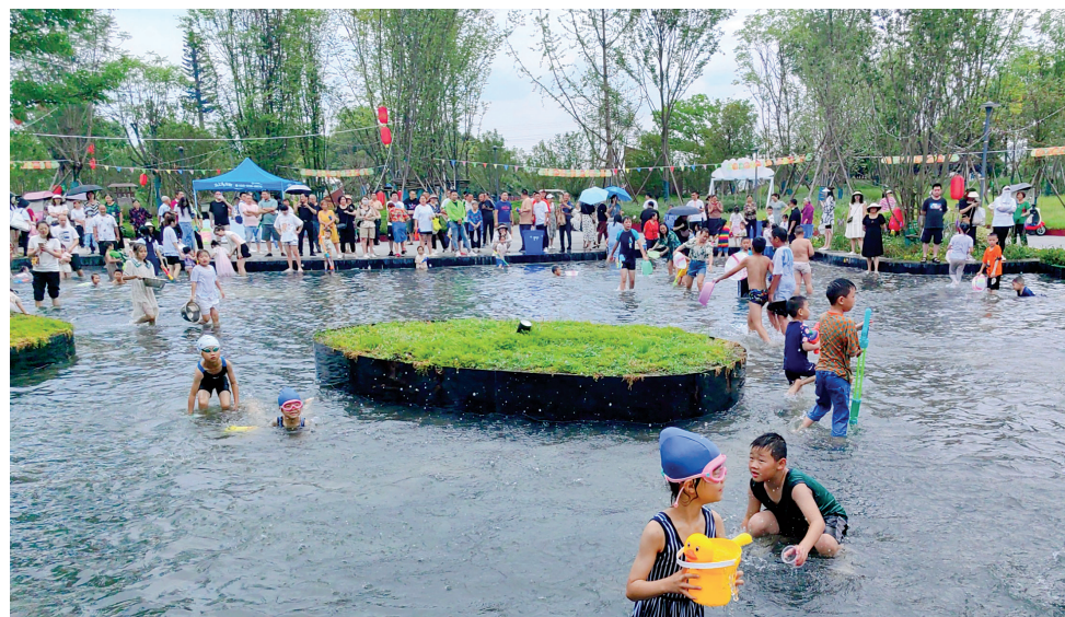
△ 游客在战旗村游玩。