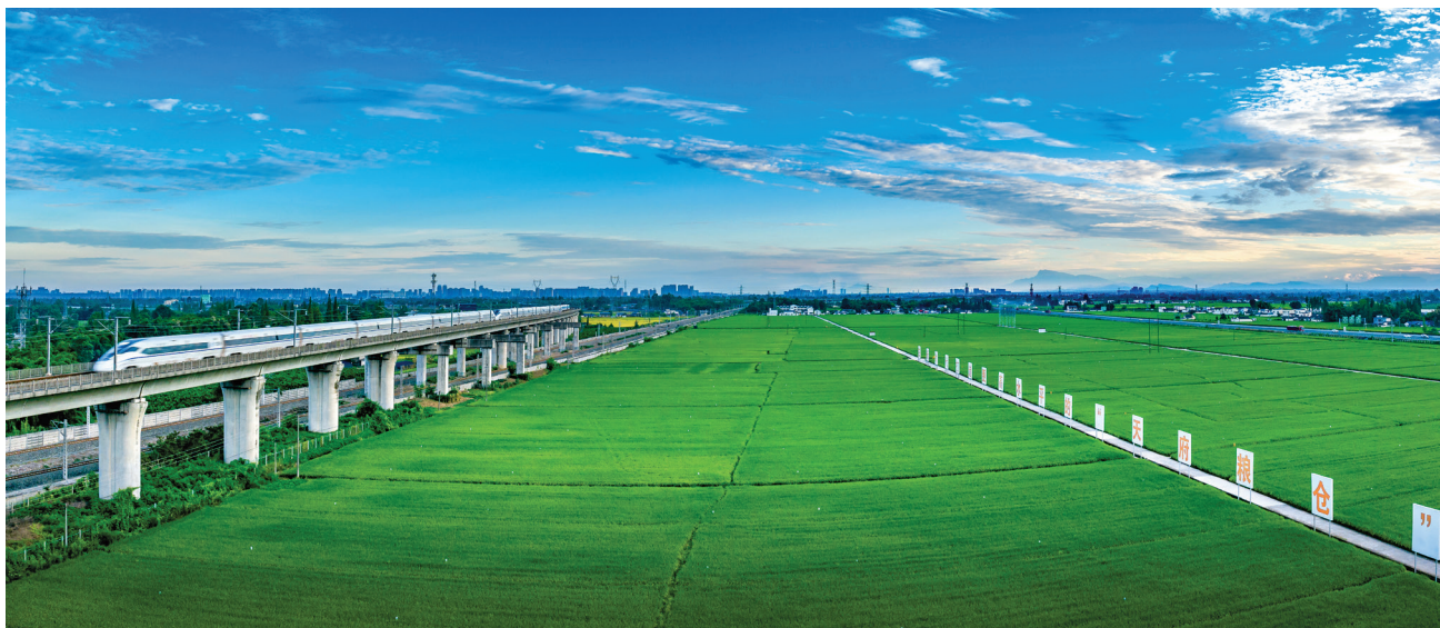
△眉山市东坡区太和镇永丰村高标准农田。

2022年6月8日,习近平总书记在眉山市东坡区太和镇永丰村高标准水稻种植基地考察。他强调,成都平原自古有“天府之国”的美称,要严守耕地红线,保护好这片产粮宝地,把粮食生产抓紧抓牢,在新时代打造更高水平的“天府粮仓”。